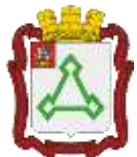
Схема размещения рекламных конструкций на территории Волоколамского городского округа